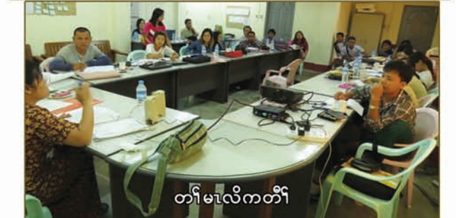
တၢ်မၤလိကတီၢ်