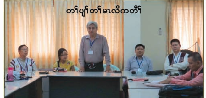
တၢ်ပျၢ်တၢ်မၤလိကတီၢ်

၁. ဒ်သိးပုၤကညီဘျာထံခဝရျာန်ဒီးကီၤသ့ၣ်တဖၣ်တၢ်ဘၣ်ထွဲတုၤအိၣ်လိာ်သးကဂုၤအဂီၢ်, ဒ်သိးကီၤသ့ၣ်တဖၣ်ကသု ဟံၣ်ဖိၣ်စံၣ်စိၤန့ၣ်တၢ်စံၣ်စိၤတဲၤတဲၤတဖၣ်အဂီၢ်, ဒ်သိးကီၤသ့ၣ်တဖၣ်တၢ်ဘၣ်ထွဲတုၤအိၣ်လိာ်သး တၢ်သုတၢ်ဘၣ်ကတုၤလီၤတီၤလီၤအဂီၢ် ပအိၣ်ဒီးတၢ်မၤသကိးတၢ်ဒီး ထုးထီၣ်ရၤလီၤလံာ်လဲၣ်ဝဲၤကျိၤ, လံာ်လဲၣ်ဒီးတၢ်ဆဲးတၢ်လၢဝဲၤကျိၤ လၢ “တၢ်သုပၤဆုတၢ်ကစီၣ်,စံၣ်စိၤန့ၣ်ဒီးတၢ်ဆဲးကျိးတၢ်မၤလိ”(၇)ဘျီတဘျီဘၣ်တၢ်မၤဝံၣ်အိၣ်ဖိ(၇-၁၂.၇.၂၀၁၆) န့ၣ်လီၤ.