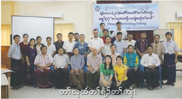
တၢ်ဃုထံတၢ်ရဲၣ်တၢ်ကျါ

၂. ဒ်သီးနံနိကယါ(၂၁)မံးရျာ်တၢ်တံာ်ကျါခံပတီၢ်တပတီၢ်တၢ်ပညိၣ် တၢ်ကွၢ်စိကလၢပၤအဂီၢ်, ပအိၣ်ဒီး တၢ်သးကျါကတံာ်ကတီၤကတၢၢ်အတၢ်တံာ်ဖျါဒ်မၤသကိး လၢအမ့ၢ် ကရၢ်(၁) တၢ်ဃုထံတၢ်ရဲၣ်တၢ်ကျါ ဒီး ကရၢ်(၅)တၢ်ထုးထီၣ်လံာ်လံာ်ဒီး တၢ်ဒုးအိၣ်ထီၣ်လံာ်ရဲၣ်တၢ်ရဲၣ်တၢ်ကျါန့ၣ်လီၤ.