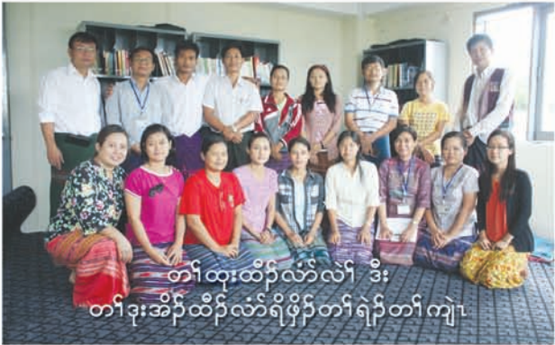
တၢ်ထုးထီၣ်လံာ်လံာ် ဒီး တၢ်ဒုးအိၣ်ထီၣ်လံာ်ရဲၣ်တၢ်ရဲၣ်တၢ်ကျါ