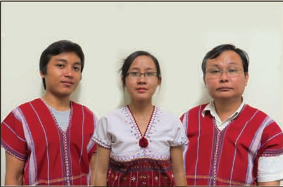
ဝဲၤကျါပုၤမၤသကိးတၢ်တဖၣ်

ဒ်ခါဆၢကတီၢ် တၢ်လဲၤထီၣ်လဲၤထီၣ်အိၣ်ဝဲအသိး လၢတၢ်မၤသကိး ခရံၣ်တၢ်သးခုကစီၣ်ကိးကပၤဒဲးအတၢ်ဘၣ်ထွဲတုၤအိၣ်လိာ်သး ကဂ့ၤထီၣ်အဂီၢ် ပုၤကညီၣ်ဘျးထံခဝုရၢၣ်သးကျါဒုးအိၣ်ထီၣ် တၢ်ဘၣ်ထွဲတုၤအိၣ်လိာ်သး ကမံးတံာ်ဖဲ(၁၉၉၉)နံၣ် လၢခဝုရၢၣ်ပာဆၢတၢ်ကမံးတံာ် ဒီဖျါကမံးတံာ်မၤတၢ် ဒီးတၢ်အာၣ်လီၤတူၢ်လိာ်အိၣ်လိာ်ပာဆၢတၢ်ကမံးတံာ်ဒီဖျါ တၢ်စံာ်ညီၣ်အာၣ်လီၤ နိၣ်ဂံၢ် (ပဆု- ၉၉.၆၂)ဒီးဘၣ်တၢ်ပံာ်ဂံၢ်ပံာ်ကျါအိၣ်ဖဲကမုၢ်တၢ်အိၣ်ဖျါဖးဒိၣ် (၈၂)ဘျီတဘျီ (က. ၉၉.၆၈)န့ၣ်လီၤ. ဖဲ(၂၀၀၅)နံၣ်, ဘၣ်တၢ်ဒုးအိၣ်ထီၣ်အိၣ်ဒ် တၢ်ဘၣ်ထွဲတုၤအိၣ်လိာ်သးဝဲၤကျါအသိးန့ၣ်လီၤ. လၢဝဲၤကျါတၢ်ဖံးတၢ်မၤအဂီၢ်ပုၤမၤသကိးတၢ်တဖၣ်မ့ၢ်ဝဲသရၣ်ဒိၣ်မုၢ်ဖျါထူ,သရၣ်မုၢ်ဂုၤဂုၤထူ,သရၣ်ကုးစၢၣ်န့ၣ်လီၤ.