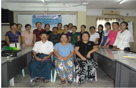
စာ်ဒုးထဲထီၣ်သရၣ်သိၣ်ထီၣ်တၢ်လၢ အိၣ်ဘၣ်န့ၣ်န့ၣ်မုၣ်မုၣ်မၤ “TOT”