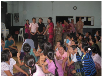
Regional Conference လၢ ECCD Trainer