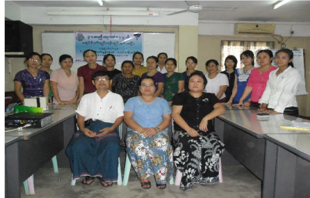
စာ်ဒုးထဲထီၣ်သရၣ်သိၣ်ထီၣ်တၢ်လၢ အိၣ်ဘၣ်ဒီးန့ၣ်သရၣ်/ မ့ၣ်တၢ်မၤလိ “TOT”