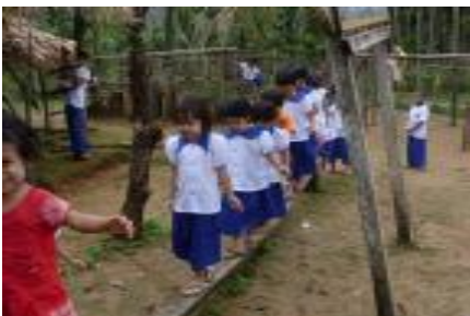
တၢ်လဲၤကွၢ်က့ၤ ECCD