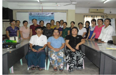
တၢ်ဒုးထဲထီၣ်သရၣ်မုၢ်ထီၣ်တၢ်လၢ အိၣ်ဘၣ်န့ၣ်န့ၣ်မုၢ်မၤလိ “TOT”