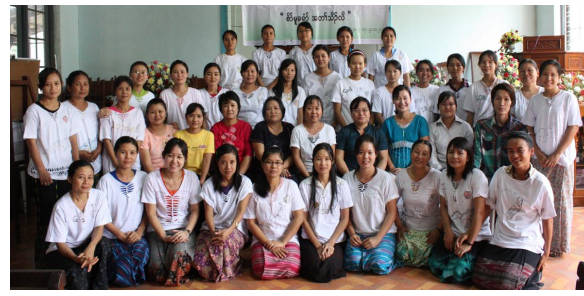
စာ်ထံၣ်လိၣ်သးဒီး Working Group လၢ တၢ်ကထွဲးထုးထီၣ် Christian Home Teacher Guide Book အဂီၢ်