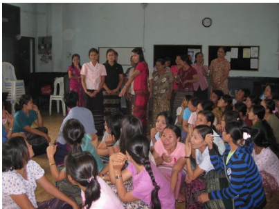
Regional Conference လၢ ECCD Trainer