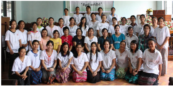
စာ်ထံၣ်လိၣ်သးဒီး Working Group လၢ တၢ်ကထံးထုးထီၣ် Christian Home Teacher Guide Book အဂီၢ်